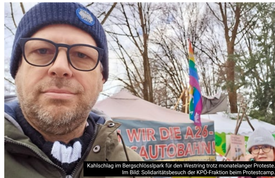
Kahlschlag im Bergschlosspark für den Westring trotz monatelanger Proteste. Im Bild: Solidaritätsbesuch der KPÖ-Fraktion beim Protestcamp.